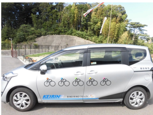
シエンタ 7人乗り 横向き

移送車4（シエンタ）( http://hwsa8.gyao.ne.jp/aozora/ )